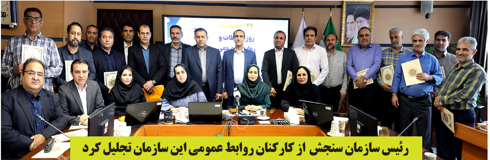
رئیس سازمان سنجش از کارکنان روابط عمومی این سازمان تجلیل کرد